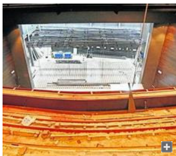
El Teatro Estable de Títeres está pendiente de los últimos retoques y la instalación del mobiliario.

V. LEÓN / CÁDIZ | ACTUALIZADO 07.10.2010 - 10:53