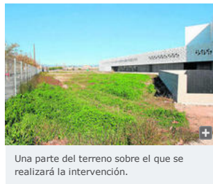
Una parte del terreno sobre el que se realizará la intervención.

La previsión, según indicó ayer la Junta en un comunicado, es que las obras se inicien a lo largo de este mes, con un plazo de ejecución de cinco meses y siete días. Junto a Bauen Empresa Constructora (entre cuyos trabajos se encuentran la restauración del pórtico principal de la Catedral de Tarazona, la reforma y ampliación de Casa de Retiros en Piedralaves y el proyecto básico y de ejecución de la nueva sede del Club Alcázar en Cádiz) presentaron sus ofertas a la convocatoria pública de adjudicación 14 compañías.