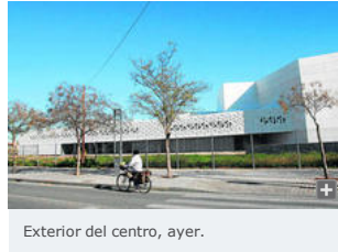
Exterior del centro, ayer.

La Consejería de Educación, Cultura y Deporte de la Junta de Andalucía ha adjudicado a la empresa madrileña Bauen Constructora las obras de reordenación del entorno del Centro de Creación Contemporánea de Andalucía en Córdoba (C4). El importe de la adjudicación asciende a 1.091.841 euros (incluido IVA), lo que supone una bajada del 39,15% respecto al presupuesto base de licitación. Los trabajos serán cofinanciados con Fondos Europeos de Desarrollo Regional-Feder.