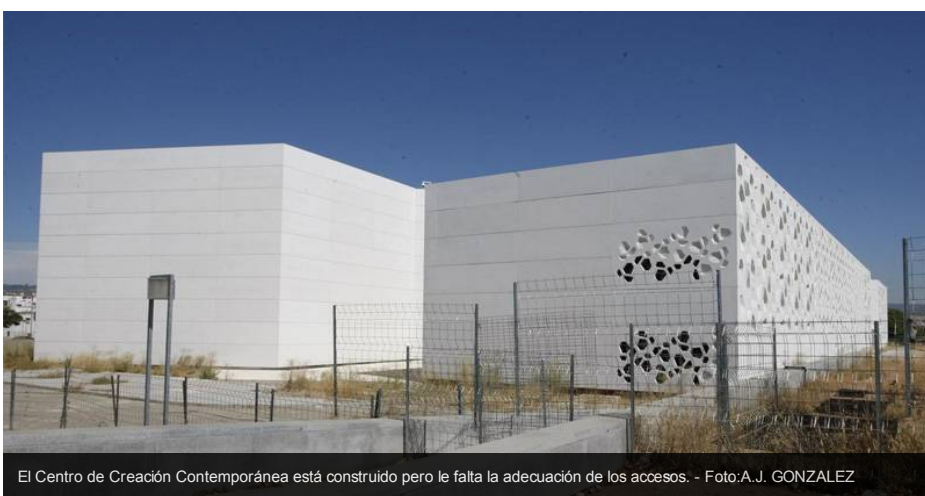
El Centro de Creación Contemporánea está construido pero le falta la adecuación de los accesos.

Enviar Imprimir Valorar Añade a tu blog 0 Comentarios