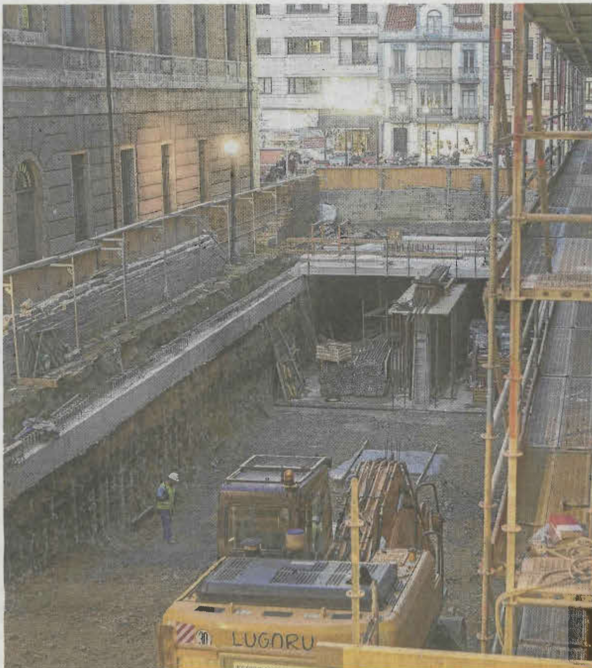
Estancia soterrada para archivar documentos que se está construyendo bajo Tomás y Valiente.