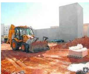
Trabajos en el entorno del Castillo de San Romualdo.