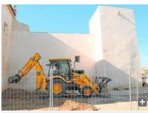
Una de las excavadoras que trabaja en la adecuación del Castillo.